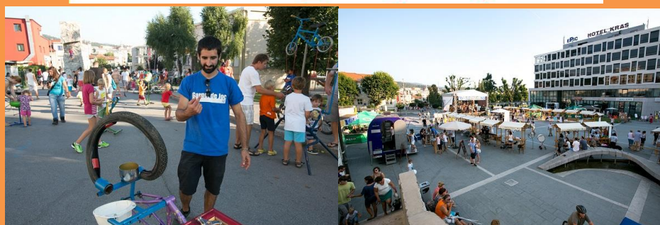
Plakat in slike iz dogajanja Po-stoj-na živi ulici 30.8.2015, dogodek je povezal več kot 150 aktivnih udeležencev oz. organizacij iz regije in širše, ter preko 3000 obiskovalcev v enem popoldnevu

Če povzamemo so neposredne koristi projekta za uporabnike in širšo družbo: