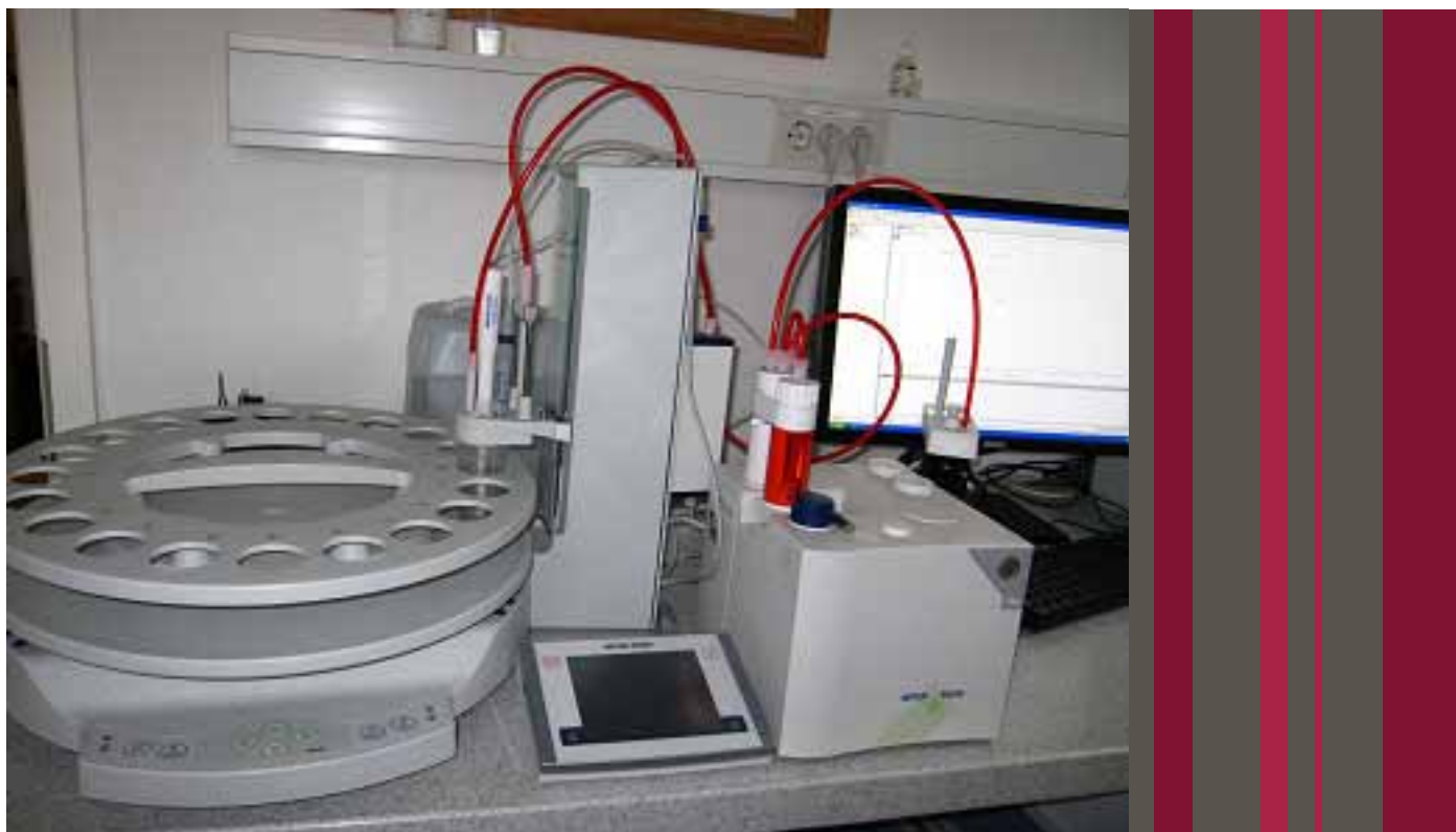
Novi potenciometrični titrator za merjenje masnega deleža srebra v zlitinah plemenitih kovin