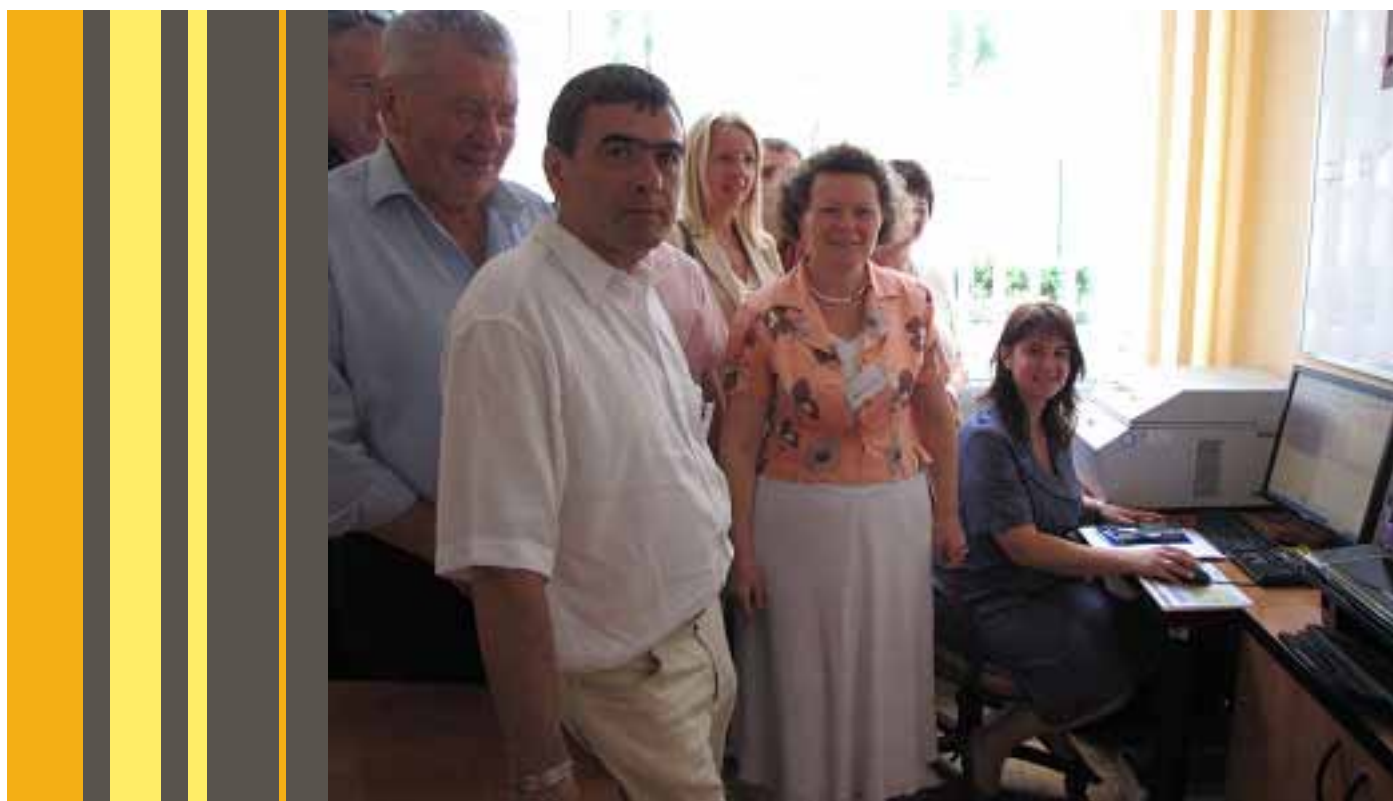
Predstavitev izvedbe preskušanje izdelkov z X-žarkovno fluorescenco (XRF) na Uradu RS za meroslovje (MIRS), Seminar za dobavitelje izdelkov iz plemenitih kovin, Celje 09. 06. 2011