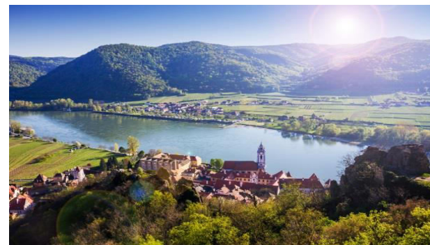
A stream of cooperation